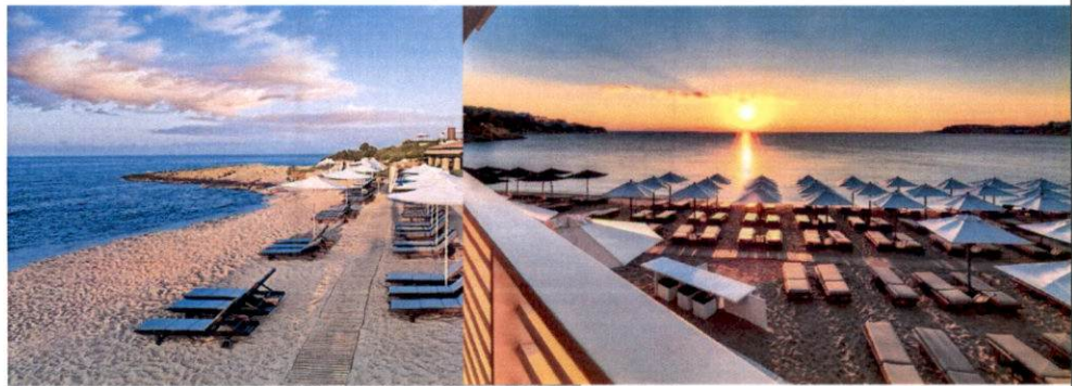
Slike: Primjeri uređenja kupališta

Ležaljke se izrađuju od PVC materijala, drveta i ostalih lakih materijala, a baldahini se izrađuju od drvene konstrukcije površine do 2 x 2.5 m, natkrivene bijelim platnom i zavjesama.