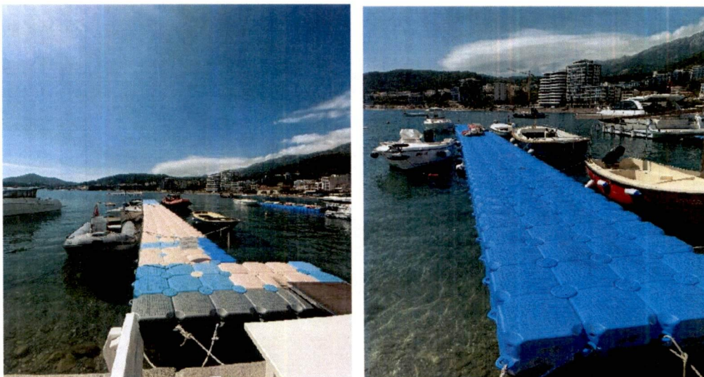
Fotografije sa lica mjesta:

Potrebno je uputiti zahtjev nadležnim inspeksijskim organima kako bi preduzeli dalje radnje iz svojih nadležnosti.