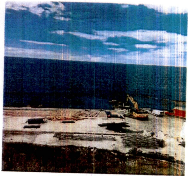
Fotografije sa lica mjesta: