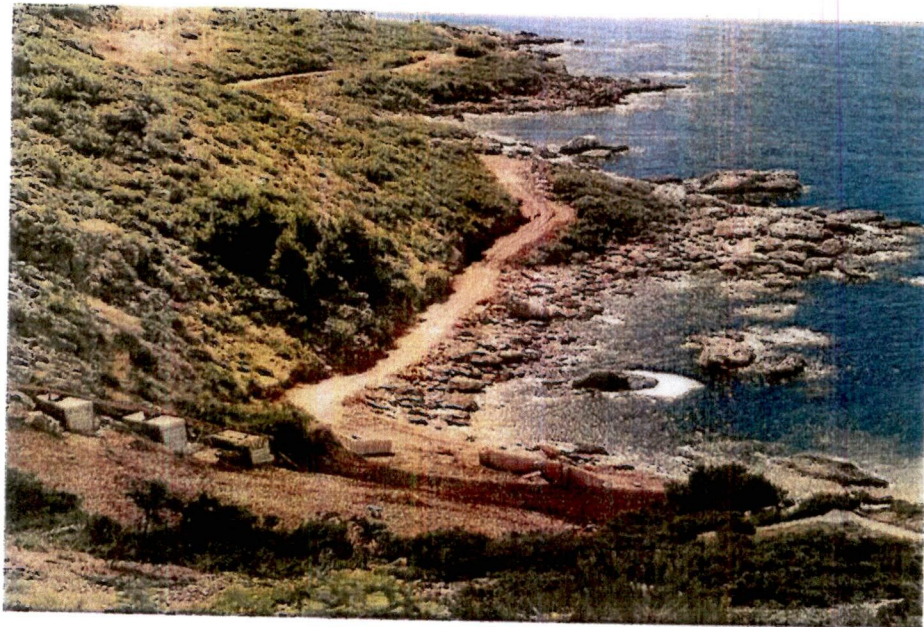
Fotografije sa lica mjesta: