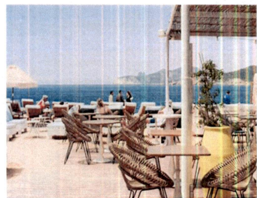
Primjer: Pokrivanje terasa tendom na dvije vode