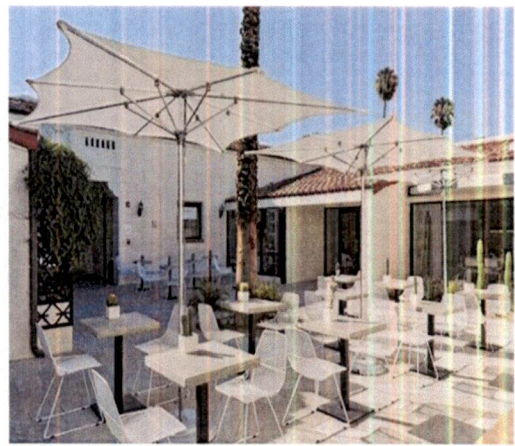
Primjer: Pokrivanja terasa suncobranima