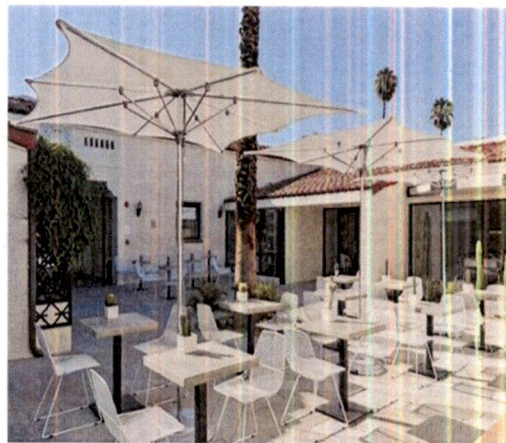
Primjer: Pokrivanja terasa suncobranima