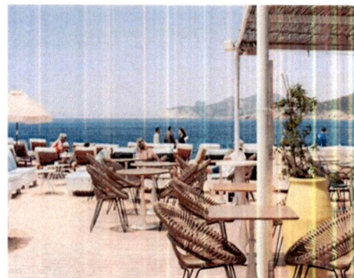
Primjer: Pokrivanje terasa tendom na dvije vode