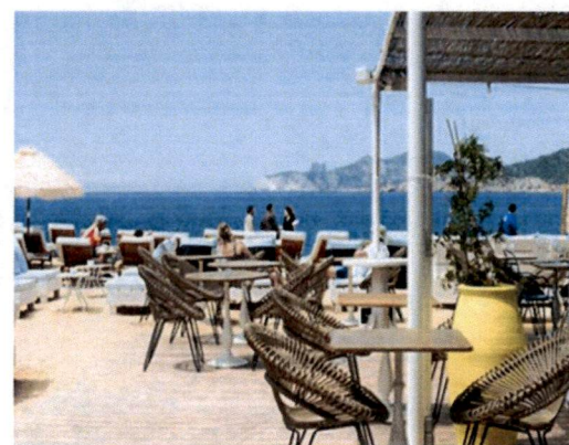
Primjer: Pokrivanje terasa tendom na dvije vode