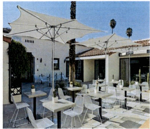
Primjer: Pokrivanja terasa suncobranima