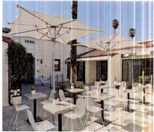
Primjer: Pokrivanja terasa suncobranima