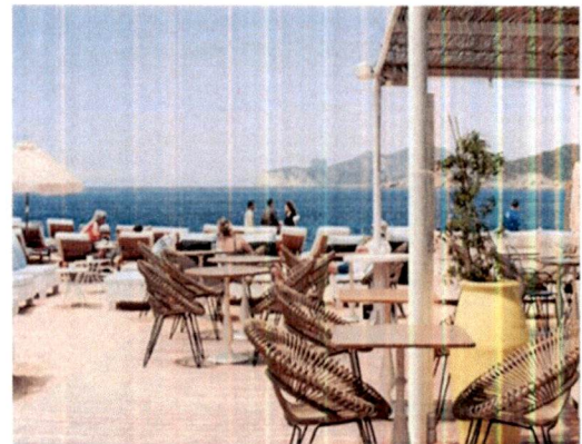
Primjer: Pokrivanje terasa tendom na dvije vode