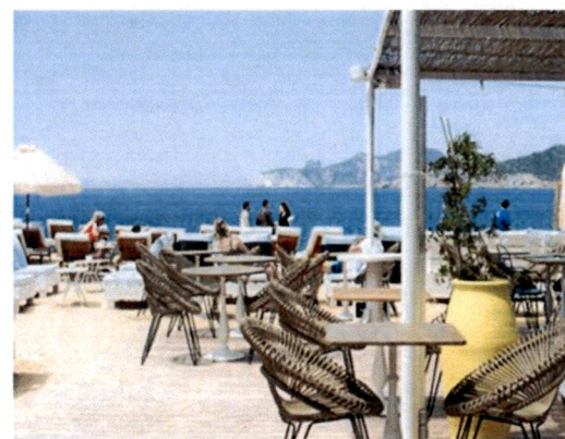
Primjer: Pokrivanje terasa tendom na dvije vode