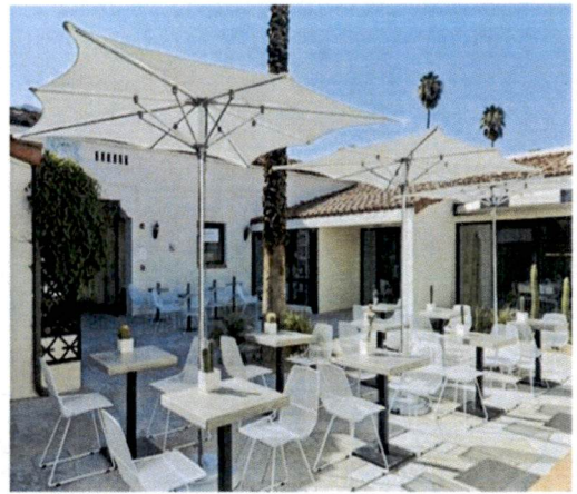
Primjer: Pokrivanja terasa suncobranima