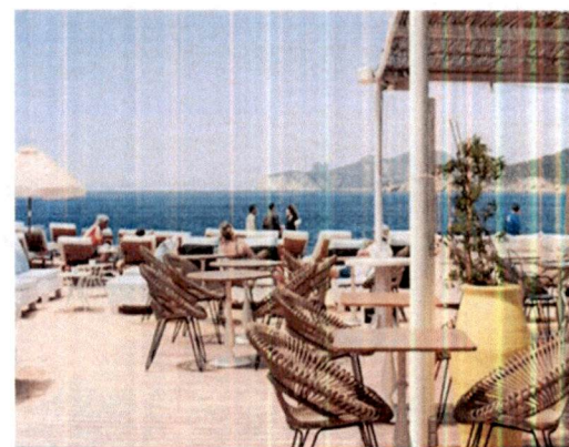
Primjer: Pokrivanje terasa tendom na dvije vode