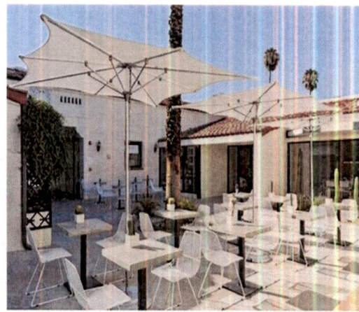
Primjer: Pokrivanja terasa suncobranima