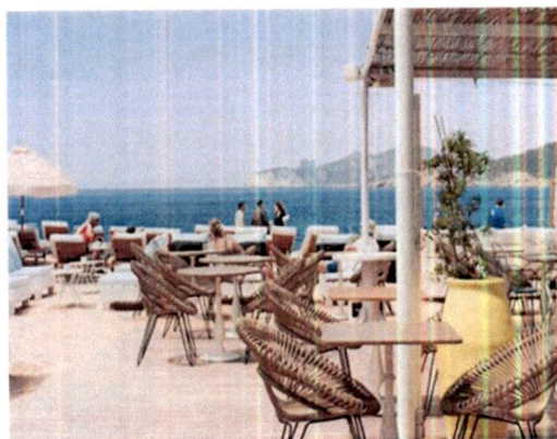
Primjer: Pokrivanje terasa tendom na dvije vode