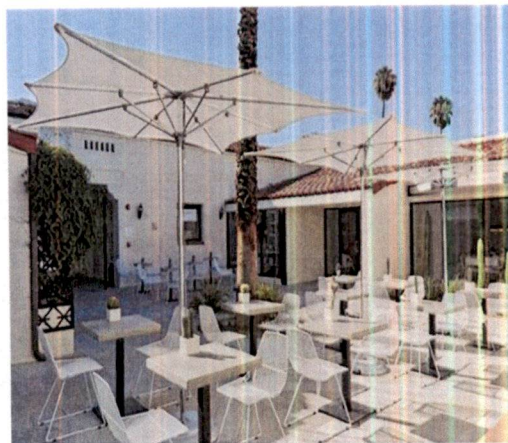
Primjer: Pokrivanje terasa suncobranima