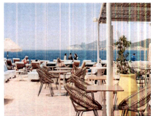
Primjer: Pokrivanje terasa tendom na dvije vode