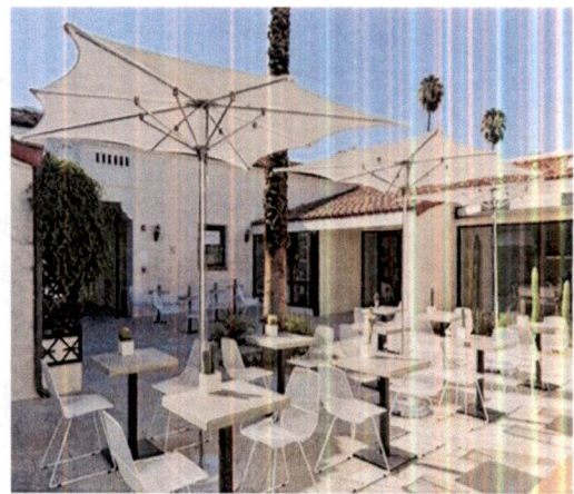
Primjer: Pokrivanja terasa suncobranima