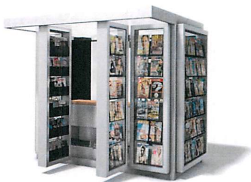
Slike: Primjeri prihvatljivog dizajna kioska za štampu u morskome dobru