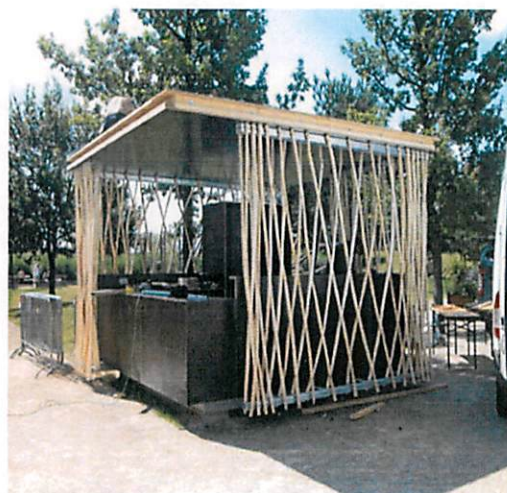
Slike: Primjeri prihvatljivog dizajna kioska za trgovinu i usluge u morskom dobru