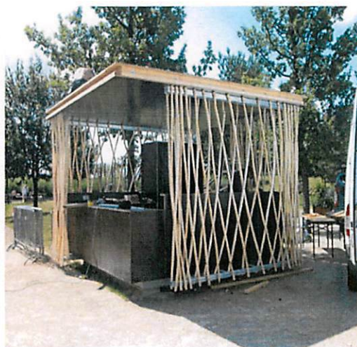
Slike: Primjeri prihvatljivog dizajna kioska za trgovinu i usluge u morskome dobru