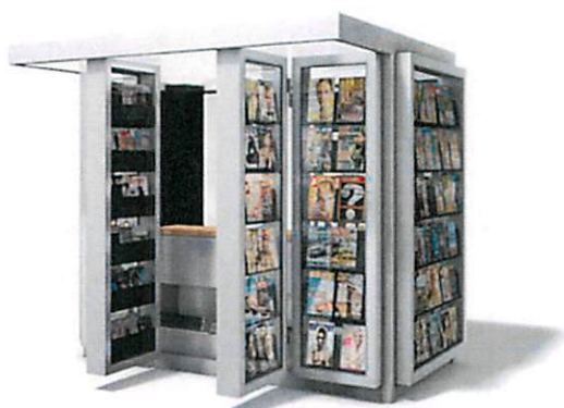
Slike: Primjeri prihvatljivog dizajna kioska za štampu u morskome dobru