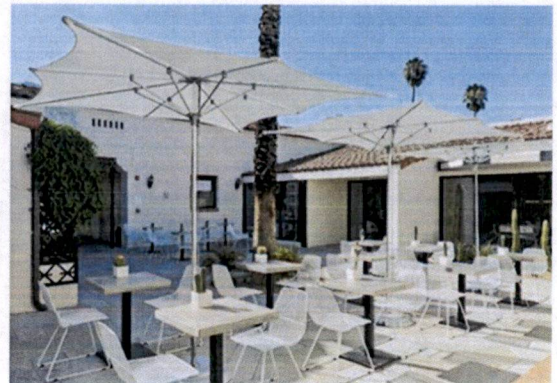
Primjeri: Pokrivanje terasa suncobranima - tip A