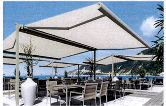
Primjeri: Pokrivanje terasa tendom na dvije vode - tip B