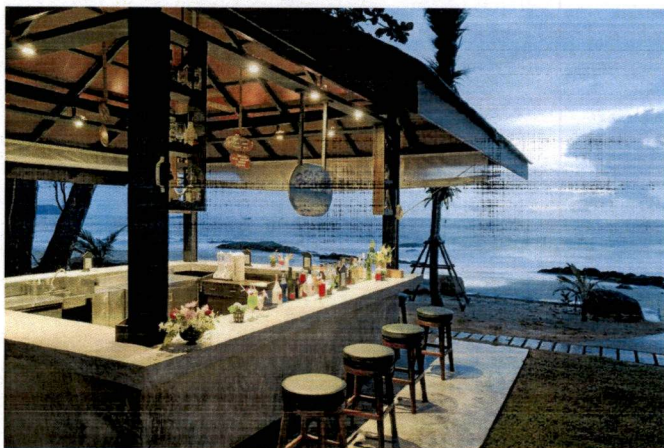
Primjer plažnog bara i terasa iz opštih smjernica Programa

- Postavljanje uređaja za hlađenje i zagrijavanje terase električnom energijom vrši se u skladu sa posebnim propisima koji se odnose na električne i termotehničke instalacije.