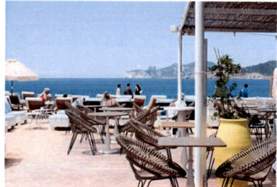
Slike: Primjer pokrivanje terasa tendom ili suncobranima.