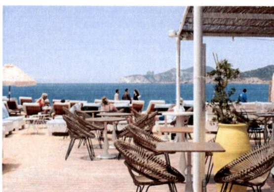
Slike: Primjer pokrivanje terasa tendom ili suncobranima.