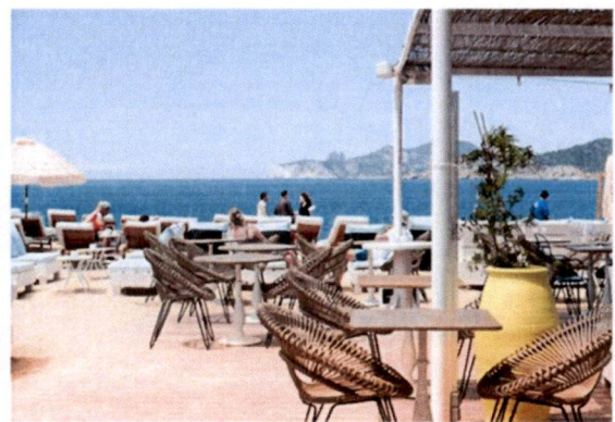
Slike: Primjer pokrivanje terasa tendom ili suncobranima.