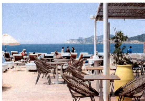
Slike: Primjer pokrivanje terasa tendom ili suncobranima.