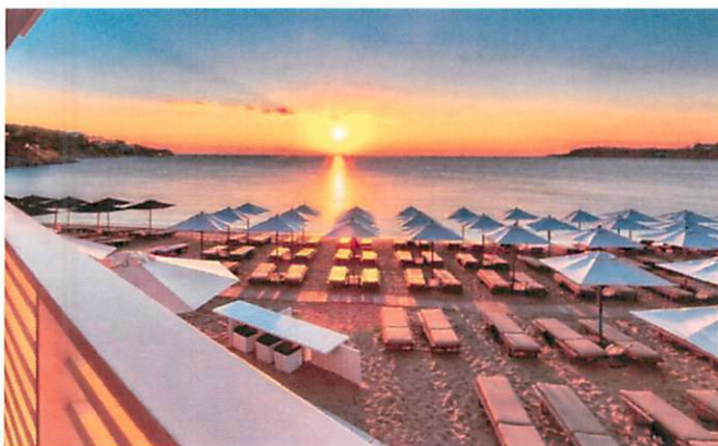
Slika: Primjeri uređenja kupališta

Ležaljke se izrađuju od PVC materijala, drveta i ostalih lakih materijala, a baldahini se izrađuju od drvene konstrukcije površine do 2 x 2.5 m, natkrivene bijelim platnom i zavjesama.