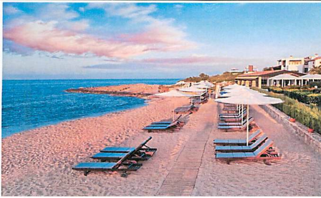
Slika: Primjeri uređenja kupališta

Plažni mobilijar (suncobrani/ležaljke/baldahini) koji se postavlja na kupalištu, kao i ostala oprema koja je u funkciji kupališta (kabine za presvlačenje i dr.) može biti samo u pastelnim bojama (bijela, bež i dr. ), a nikako sa reklamnim natpisima.