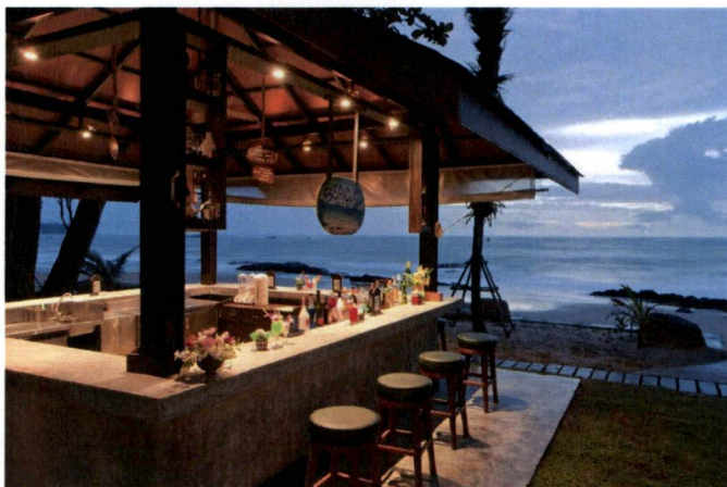
Primjer plažnog bara i terasa iz opštih smjernica Programa

- Postavljanje uređaja za hlađenje i zagrijavanje terase električnom energijom vrši se u skladu sa posebnim propisima koji se odnose na električne i termotehničke instalacije.