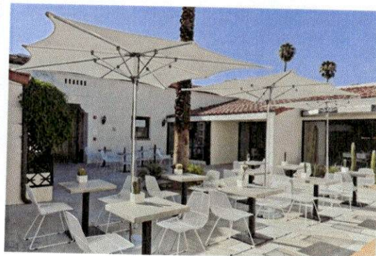
Slika:ugostiteljski objekat sa terasom