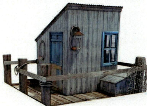
Primjer izgleda ribarske kućice