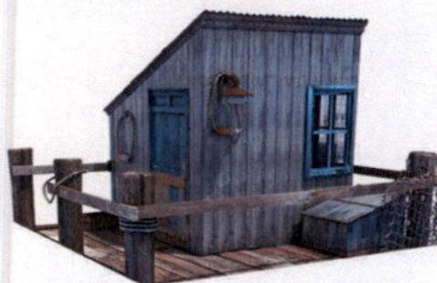
Primjer izgleda ribarske kućice