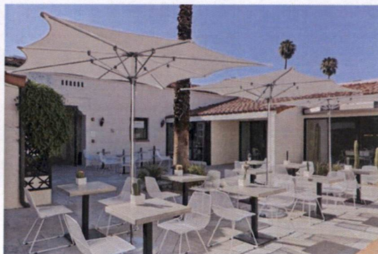
Slika:ugostiteljski objekat sa terasom