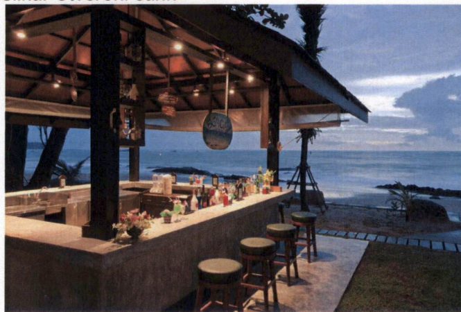
Slika: Otvoreni šank

- Za ugostiteljsku terasu čija bruto površina ne prelazi 60m 2 , tehničku dokumentaciju čini idejno rješenje, kao i fotografije opreme koja se postavlja na ugostiteljskoj terasi, dok za ugostiteljsku terasu čija je bruto površina veća od 60 m 2 , tehničku dokumentaciju čini revidovan glavni projekat.